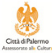
Comune di Palermo