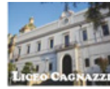
Liceo classico Luca de Samuele Cagnazzi